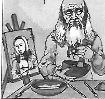
Leonardo da Vinci (1452-1519) Gioconda margotzen.