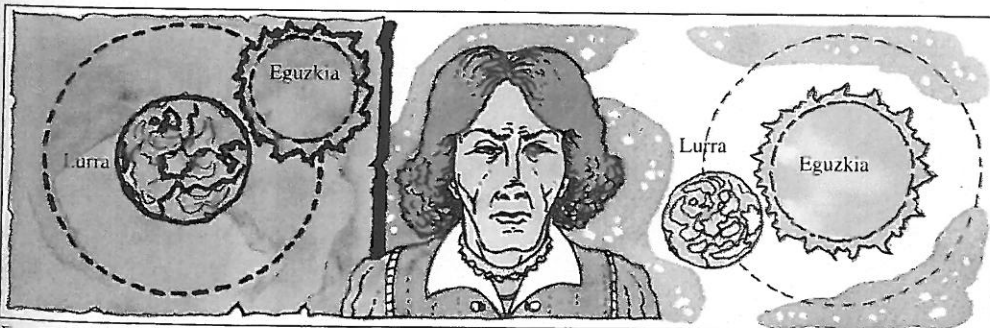
Eguzkiak Lurraren inguruan birak ematen zituela zioen Elizak.

XV. eta XVI. mendeetan hirietako jende kopurua hazi egin zen eta nekazari giroko biztanle goa gutxitu: jendea hiritartu egin zen. Hiriko bizimodu honek ideien eta ohituren aldaketa nabaria eragin zuen.