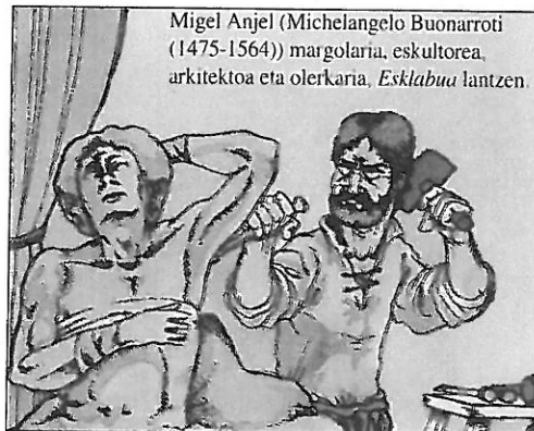
Migel Anjel (Michelangelo Buonarroti (1475-1564)) margolaria, eskultorea, arkitektoa eta olerkaria, Esklabua lantzen.