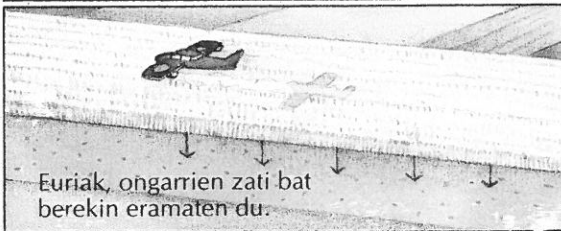
Euriak, ongarmien zati bat berekin eramaten du.