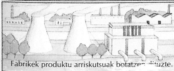
Fabrikek produktu arriskutsuak botatzen dituzte.

Ura kutsatzen da, bertara hondakinak eta zaborra botatzen direlako. Produktu hauek, landareak eta animaliak pozointzen dituzte. Kutsadura hau gutxitzeko, ur garbitegiek ura garbitzen dute eta ibaira berriro itzuli.