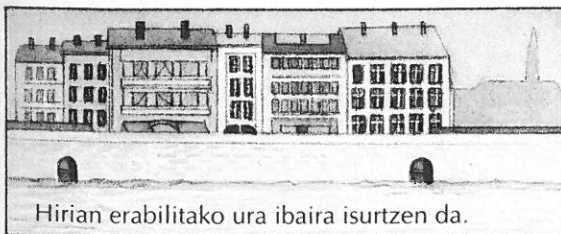
Hirian erabiltzeko ura ibaira isurtzen da.